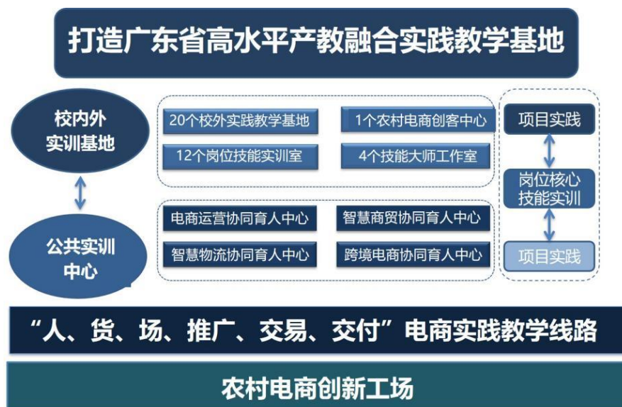
图 6：“农村电商创新工场”建设框架